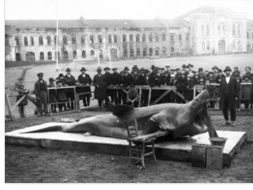
Lufer Bogazin Prensi (Bluefish)