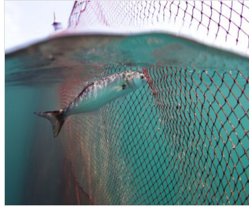
Lüfer, Bir Balığın Var Olma Savaşı