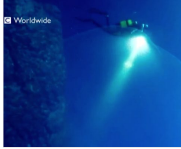
Şey: Su Altında Ne Olduğu Anlaşılamayan Şeffaf Cisim