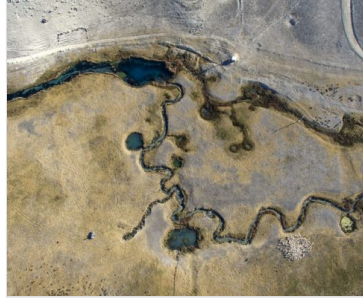
Bir Nehir Direniyor – S A K A R Y A