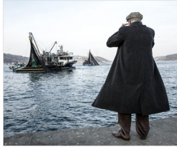
Lüferin macerası belgesel oldu