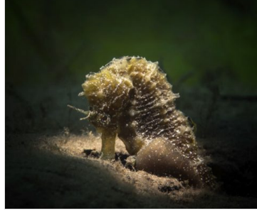
Deniz Atlarının Çiftleşme Mevsimi (Magma Dergisi)