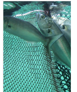
Lüfer, Bir Balık Olma Savaşı